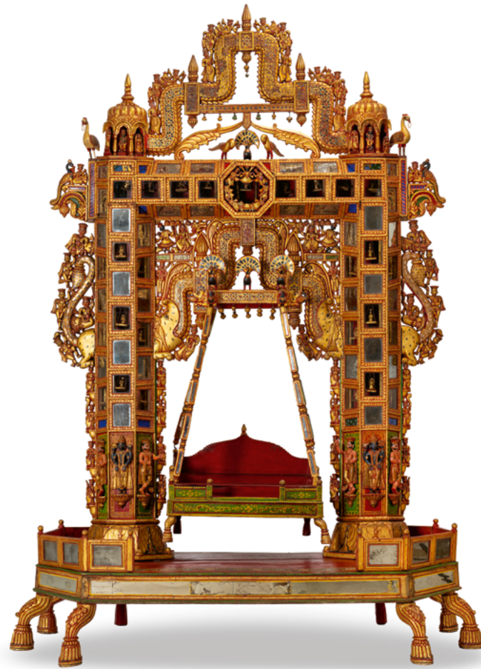
Schaukel für Krishna-Figuren, Jaisalmer, spätes 19. bis 20. Jh., Holz, Glas, Blattgold, 265 x 180 x 86 cm, Inv.-Nr. 98-320 103

Die Exponate stammen aus verschiedenen Epochen, Regionen und Kontexten und reichen von historischen Gegenständen bis zu zeitgenössischen Ausdrucksformen. Zu sehen sind unter anderem eine prächtige Schaukel und ein tragbarer Klappaltar ebenso wie populäre Posterdrucke und zeitgenössische Figuren. Ein besonderes Highlight sind fünf kostbare, großformatige religiöse Wandbehänge (Pichwais).